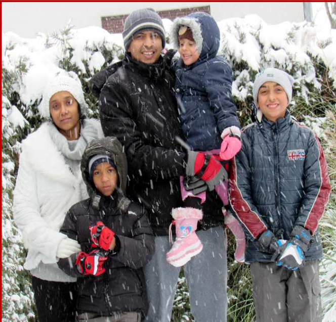
Início de ano com muito frio e neve

Passamos o final de ano na Eslovênia na casa de um missionário brasileiro e fizemos uma virada de ano evangelística.