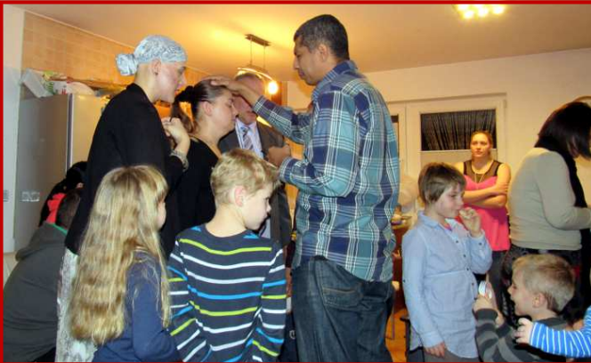
Culto evangelístico da virada na Eslovênia.