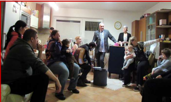
Culto evangelístico da virada na Eslovênia.